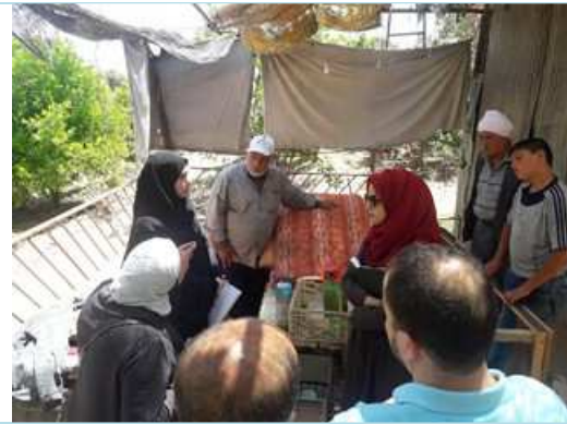
Meeting with project affected family