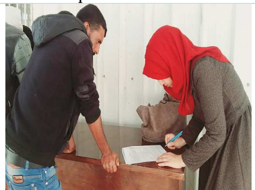
Meeting with the PAP