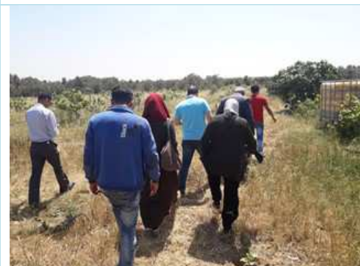
Site visit to show the PAPs well locations