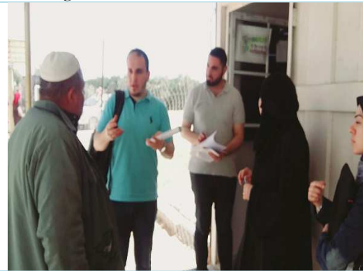
Further clarifications from PWA