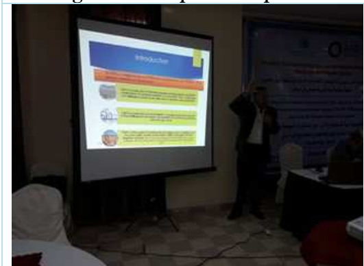
Scoping meeting presentation 23 rd of April 2018