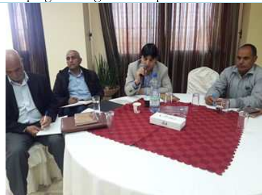
Scoping meetings participants 23 rd of April 2018