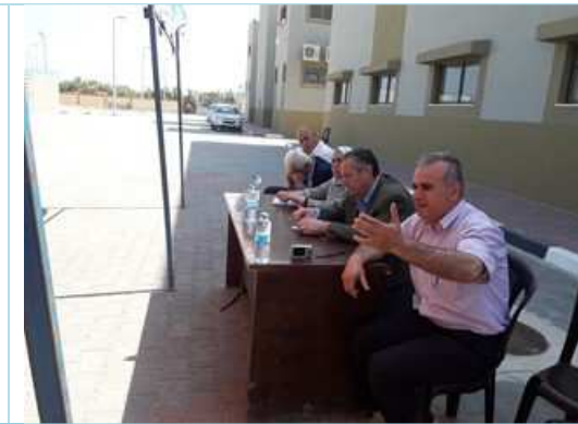
PWA representative and the RAP and ESIA consultants