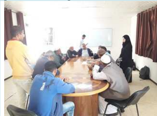
Clarification session between PWA and the PAPs 24 th of April 2018