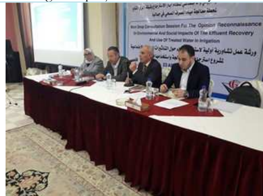
Scoping meeting 23 rd of April 2018