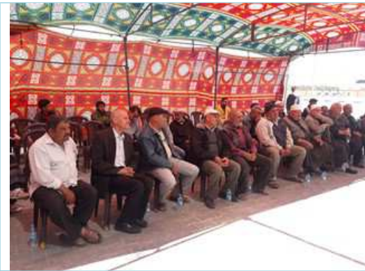
Group meeting with the project affected persons 24 th of April 2018