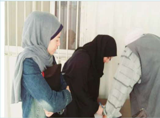
Meeting with a PAP