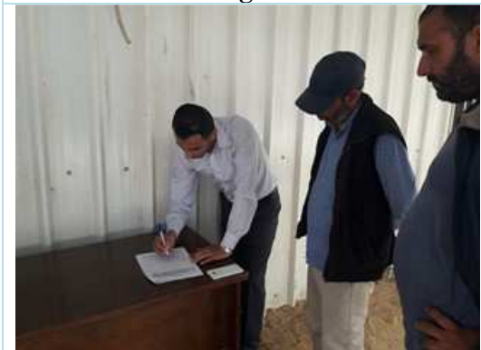
Meeting with well operator April 2018