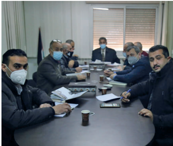
اجتماع المدراء العامون والمستشارون في سلطة جودة البيئة

والذي يؤدي الى تحسين بيئة العمل للوصول الى الأهداف المطلوبة، والمتابعة الدائمة لتنفيذ التوصيات والإجراءات الداخلية والخارجية حسب الأنظمة والقوانين المعمول بها.