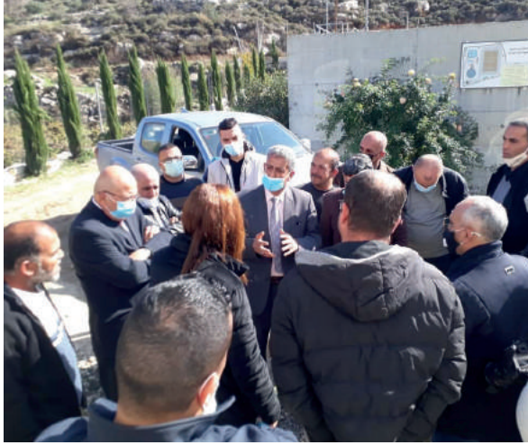
جولة تفقدية لمحطة العروب لمعالجة المياه العادمة في شيوخ العروب

وبناء على هذه الاستراتيجية الأخيرة فقد وضعت الاهداف الاستراتيجية لقطاع البيئة على النحو التالي: