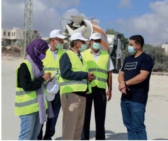
جولة تفقدية لعدد من المنشآت في بلدة جفنا في محافظة رام الله والبيرة