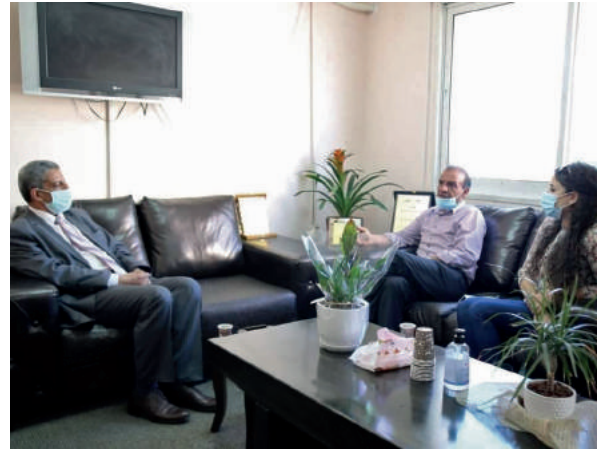
لقاء عمل مع مركز لاجئ الفلسطيني