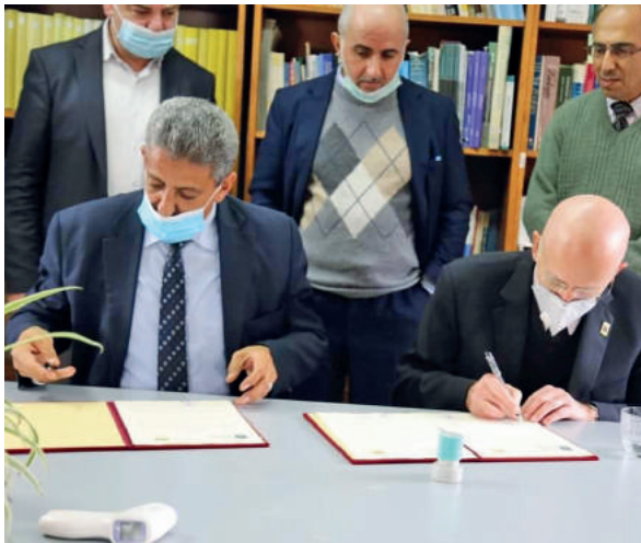
توقيع مذكرة للتعاون المشترك مع جامعة بيت لحم والمتحف الطبيعي التابع للجامعة