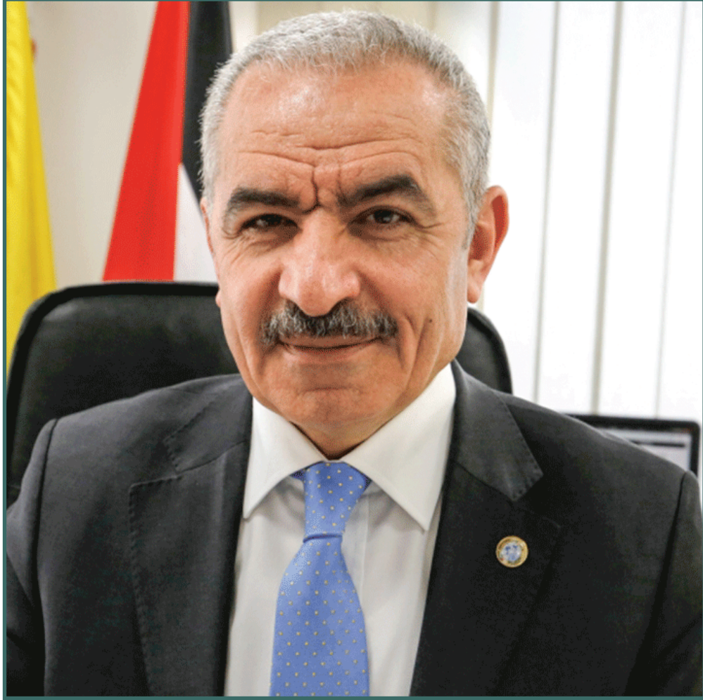
دولة رئيس الوزراء د. محمد اشتية حفظه الله ورعاه