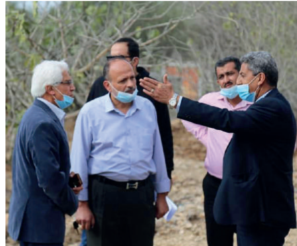
جولة في حدائق مركز بيرك في بلدة تل في محافظة نابلس