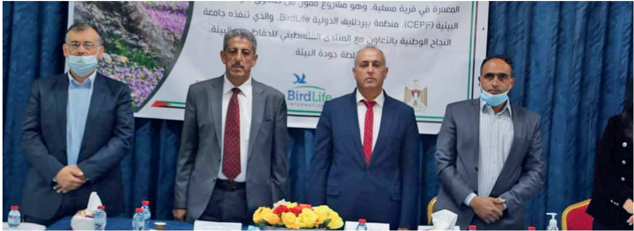
احتفالية اختتام مشروع الحفاظ على التنوع الحيوي في مسلية في محافظة جنين