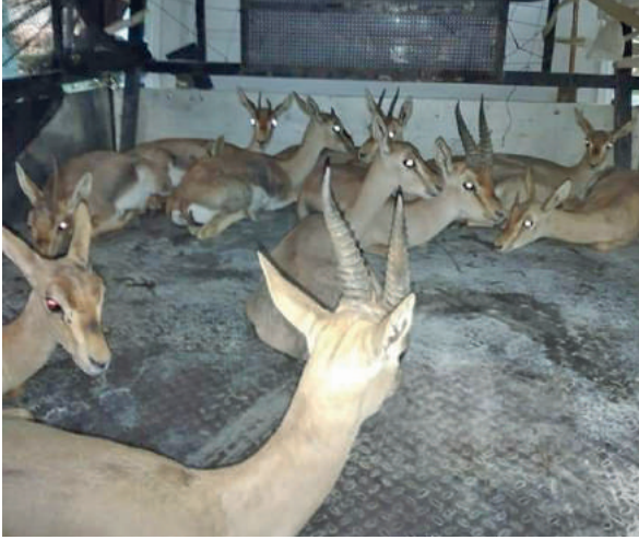
مجموعة غزلان فلسطينية تم تأهيلها واطلاقها في جبال الوطن