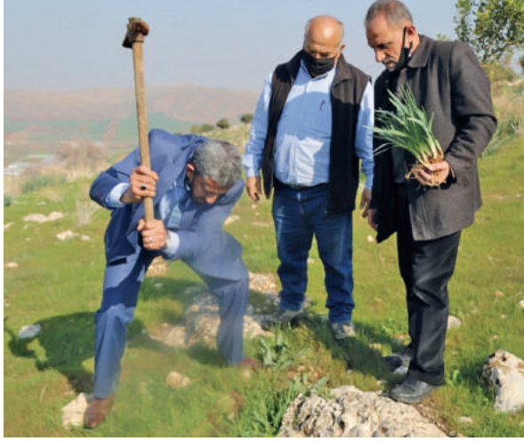
زراعة سوسنة الشفا في محمية طمون في محافظة طوباس