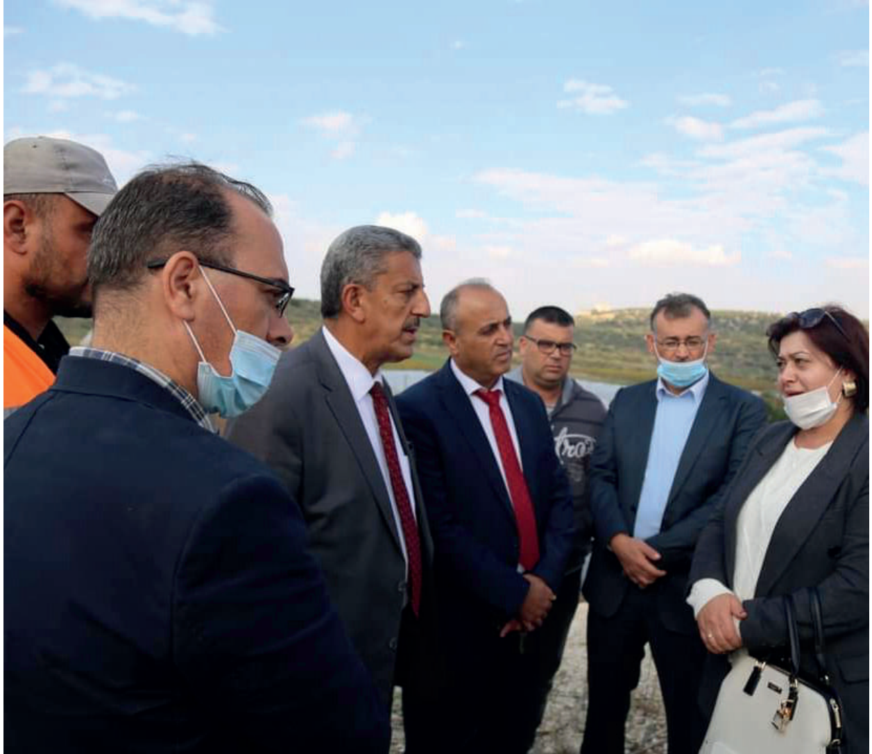
اختتام مشروع بيئي وجولة تفقيده في بلدة مسلية في محافظة جنين