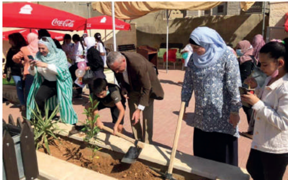
فعالية بيئية وزراعة اشغال في كفر عقب/ محافظة القدس

وفيما يلي نوضح بالجدول ادناه نسبة تنفيذ كل بند من كل موازنة برنامج معتمد من البرامج الثلاث وهي كالاتي: