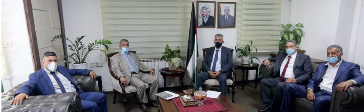
اجتماع عمل مع معالي وزير الحكم المحلي م. مجدي الصالح