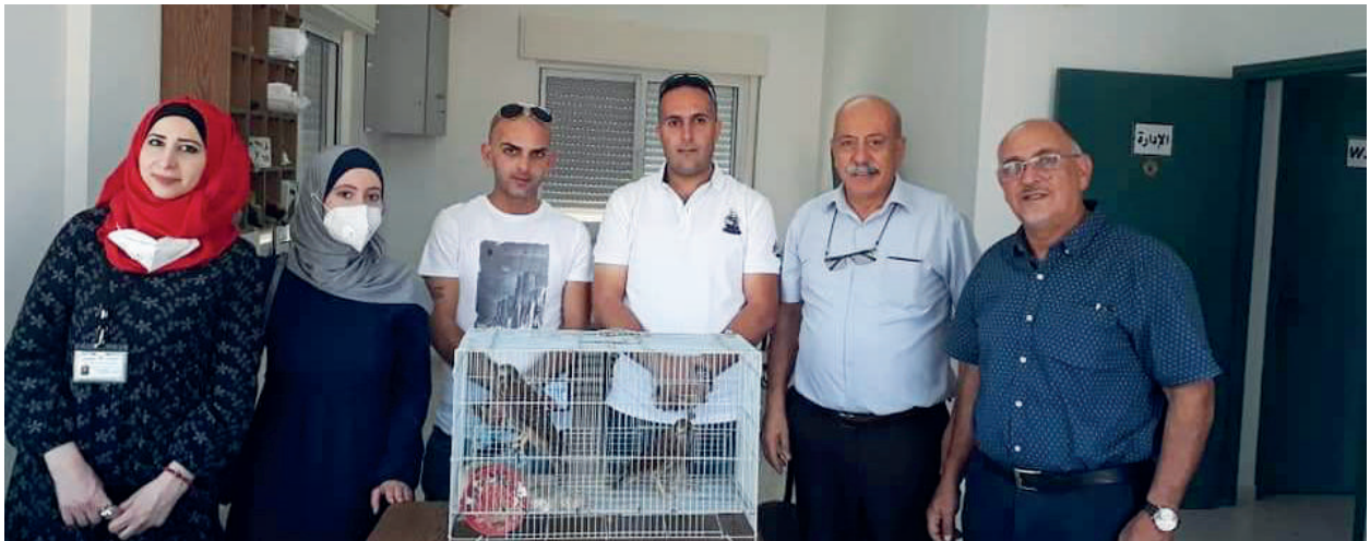
إعادة تأهيل وإطلاق طيور فلسطينية مهددة بالانقراض