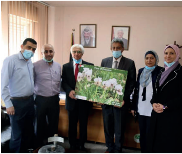
اجتماع عمل مع رئيس مركز بيرك -مقر سلطة جودة البيئة