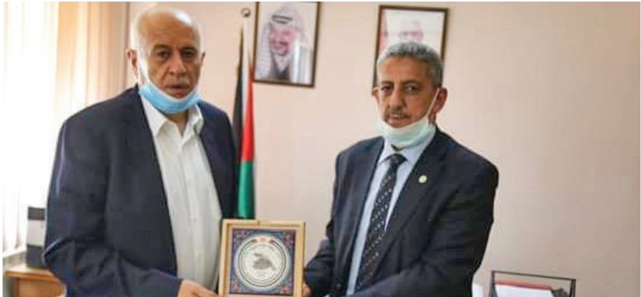
توقيع مذكرة تفاهم - رئيس جمعية الكشافة الفلسطينية سيادة اللواء جبريل الرجوب ومعالى رئيس سلطة جودة البيئة أ.جميل مطور