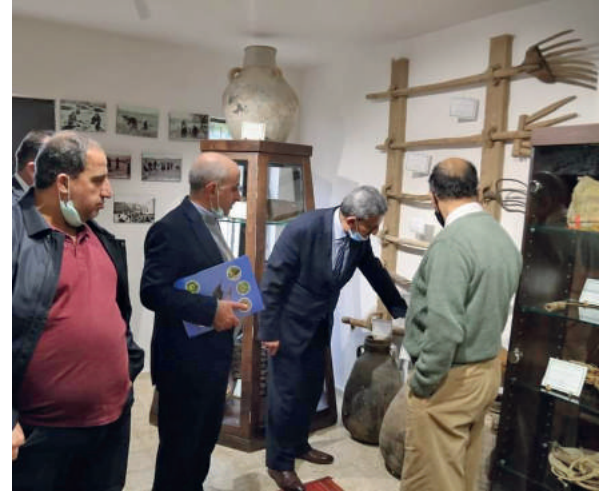
جولة تفقدية في اقسام متحف فلسطين للتاريخ الطبيعي في محافظة بيت لحم