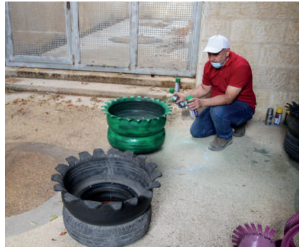
إعادة التدوير والاستعمال من كادر سلطة جودة البيئة