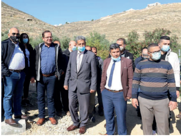
جولة تفقدية لمنطقة محطة معالجة المياه العامة في محافظة الخليل

تمت معالجة الجزء اليسير جدا من متأخرات الأعوام السابقة وذلك بسبب عدم الإيفاء من قبل وزارة المالية بالتزاماتها اتجاهنا طوال العام المنصرم 2020 مما أثر ذلك على تراكم الكثير من المعاملات المالية كمتأخرات ينبغي البدء بالعمل عليها مع وزارة المالية للإيفاء بكافة الالتزامات مع موردي الخدمات المقدمة لنا. وبالجدول ادناه نبين لكم نسبة تنفيذ كل بند على حدا من كافة موازنات البرامج الثلاث والمعتمدة لدينا.