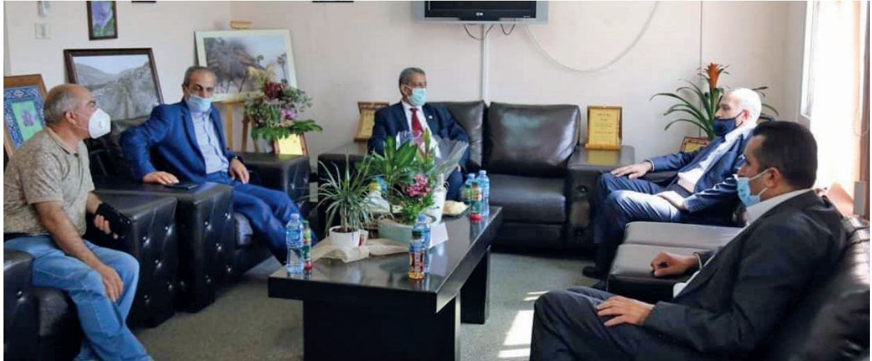
لقاء عمل مع معالي وزير الاتصالات وتكنولوجيا المعلومات د. إسحاق سدر