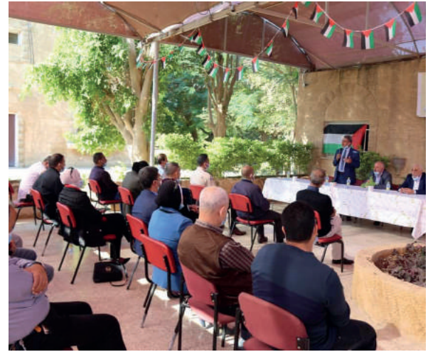
افتتاح مخيم بيئي زراعي في مدينة اربحا