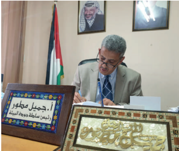
أ. جميل مطور رئيس سلطة جودة البيئة