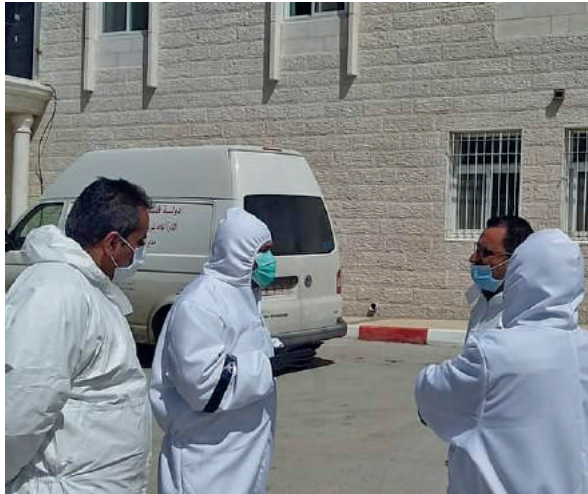
مفتشي البيئة في الميدان ومتابعة تحدي النفايات الطبية

الحصول على الموافقة وتجنيد الأموال لمشروع وفرة المياه وتكيف قطاع الزراعة مع التغيرات المناخية في قطاع غزة والبالغة قيمته 45 مليون يورو حيث بلغت قيمة المنحة من صندوق المناخ الأخضر 23 مليون يورو. وقد تم التوقيع على الاتفاقيات برعاية دولة رئيس الوزراء وبمشاركة: وزير المالية، وزير الزراعة، رئيس سلطة جودة البيئة، رئيس سلطة المياه، القنصل الفرنسي، مدير مكتب الوكالة الفرنسية للتنمية ومدير مكتب منظمة الاغذية والزراعة الدولية.