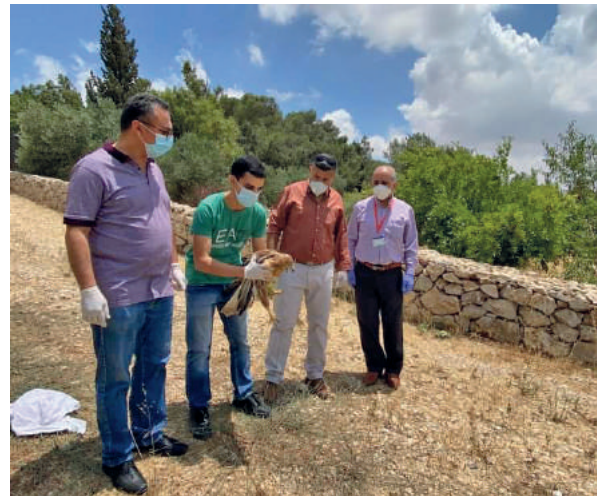
إطلاق طيور مهددة بالانقراض بعد تأهيلها وعلاجها