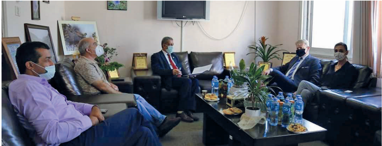
لقاء عمل مع سعادة سفير بولندا لدى دولة فلسطين