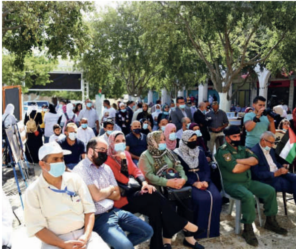
معرض التنوع الحيوي في ساحة المهدي في محافظة بيت لحم