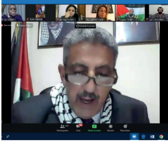
رعاية مؤتمر للكشاف العربي تحت شعار «الكشاف صديق للبيئة» عبر تقنية الاتصال المرئي