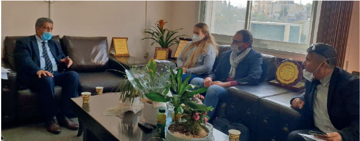
اجتماع عمل مع مؤسسة شيزفي الإيطالية حول المخلفات الالكترونية والكهربائية

دور تنسيقي وتنظيمي، حيث تقوم سلطة جودة البيئة بتنسيق الانشطة المختلفة الهادفة الى تحسين ومراقبة البيئة من قبل الجهات المختلفة من مؤسسات حكومية وأهلية وكذلك المؤسسات الاقليمية والدولية بما فيها