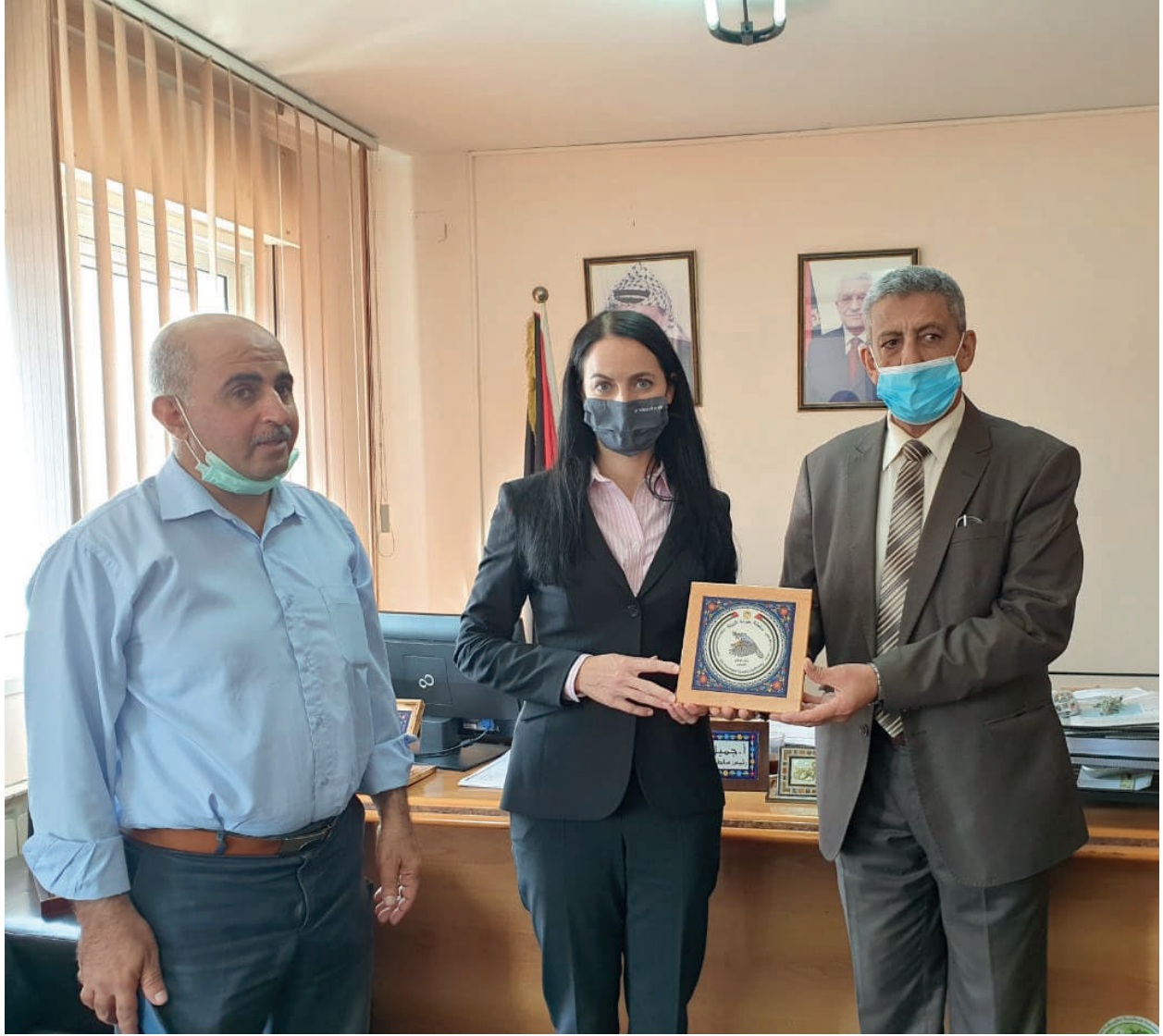
في ختام مشروع مشترك مع مؤسسة هانز زايدل الألمانية