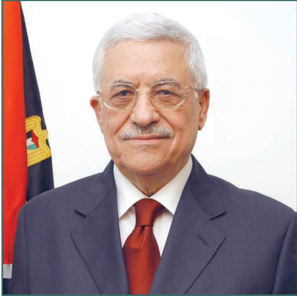
فخامة رئيس دولة فلسطين محمود عباس / ابو مازن حفظه الله ورعاه