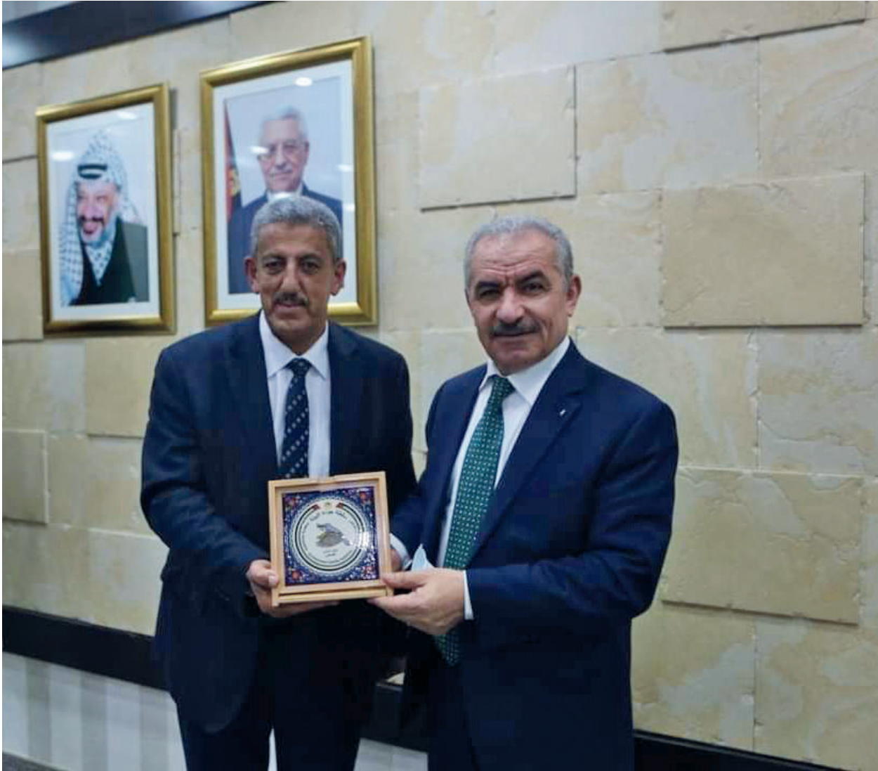
مع دولة رئيس الوزراء د. محمد اشتية في مكتبه في مدينة رام الله