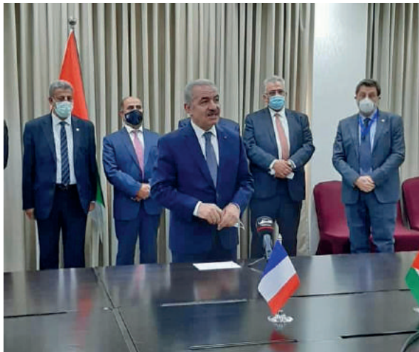
برعاية وحضور دولة رئيس الوزراء د. محمد اشتية في مقر مجلس الوزراء وتوقيع اتفاقية تمويل مشروع بيئي لصالح قطاع غزة