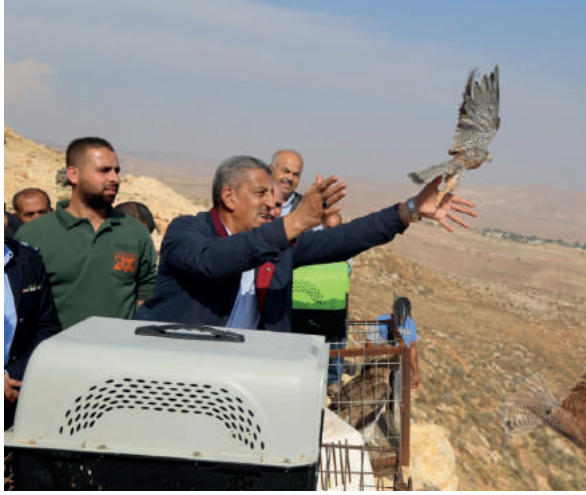
إطلاق طيور وغزلان فلسطينية بعد تأهيلها في محمية دوما في محافظة نابلس