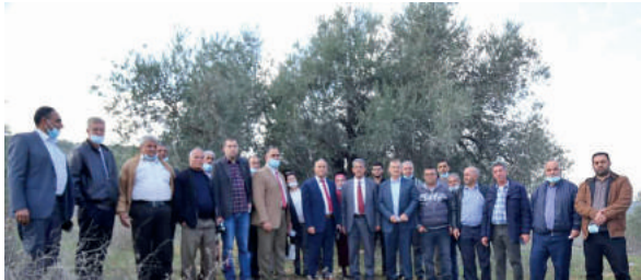
فعاليات بلدة مسلية في اختتام مشروع بيئي رياضي

من الجدير بالذكر أن سلطة جودة البيئة وحسب المهام الموكلة لها كما عرضنا في الفقرات السابقة هي جهة غير تنفيذية وإنما تنسيقية وتنظيمية وتمارس أعمال رقابية وتفتيشية، وبالتالي فإن الصبغة العامة على أنشطتها وانجازاتها تنحصر في هذه الجوانب ولا تتعداها الى جوانب تنفيذية لمشاريع على الأرض كما هو الحال في المؤسسات التي تنفذ مشاريع بنية تحتية وغيرها. وان وجدت بعض المشاريع التنفيذية من بين انجازاتها فإنها تكون رياضية وتجريبية لأغراض البحث والتعليم واستخلاص النتائج. في هذا الجزء من التقرير سوف نقدم الانجازات التي حققتها سلطة جودة البيئة في عملها خلال العام المنصرم 2020.