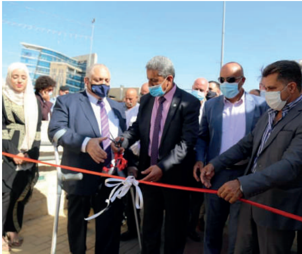
افتتاح معرض التنوع الحيوي في مدينة رام الله على ارض حديقة الاستقلال