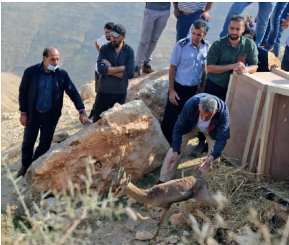
إطلاق غزلان الجبل الفلسطيني على أراضي محمية فصايل