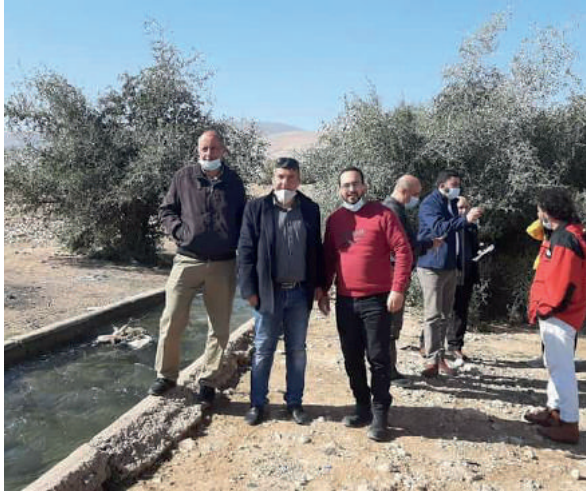
عمل ميداني في سياق إعادة تأهيل نبعة العوجا في محافظة اربحا