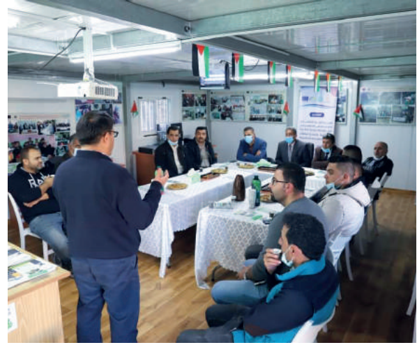
اجتماع عمل في مقر جمعية نقاء لإعادة التدوير في بلدة إدنا في محافظة الخليل

إصدار دليل إرشادي للتعامل مع النفايات الصلبة للحد من تفشي فيروس كورونا. إصدار ورقة حقائق حول أهمية هجرة الطيور الخريفية.