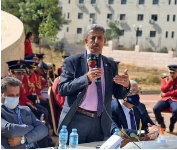
افتتاح معرض التنوع البيئي الحيوي في حديقة الاستقلال في محافظة رام الله والبيرة