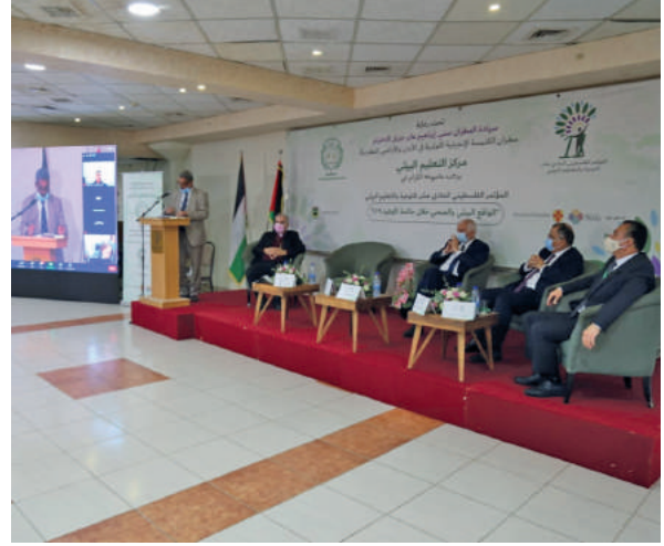
المؤتمر البيئي الحادي عشر في مدينة بيت لحم